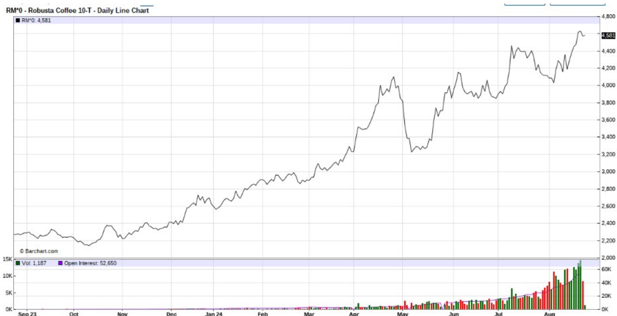
CAFFÈ ROBUSTA-ANDAMENTO BORSA DI LONDRA ULTIMI 12 MESI